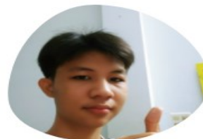
VẬT LÝ TRẦN PHÚC QUÝ